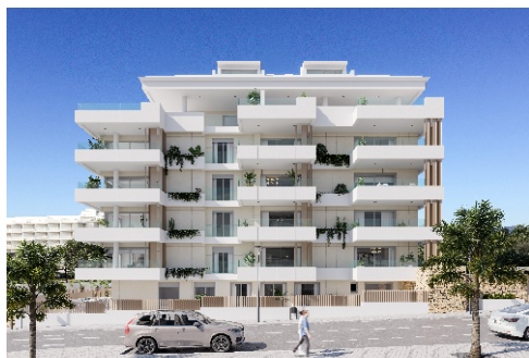
AVENIDA DEL MAR